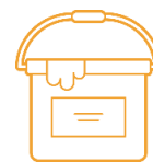
Farby i lakiery