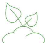
Podłoża uprawowe, polepszacze gleby i ściółka ogrodnicza